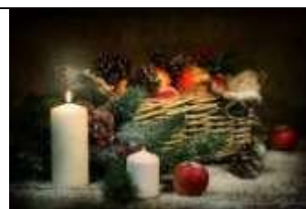
А) Новый год